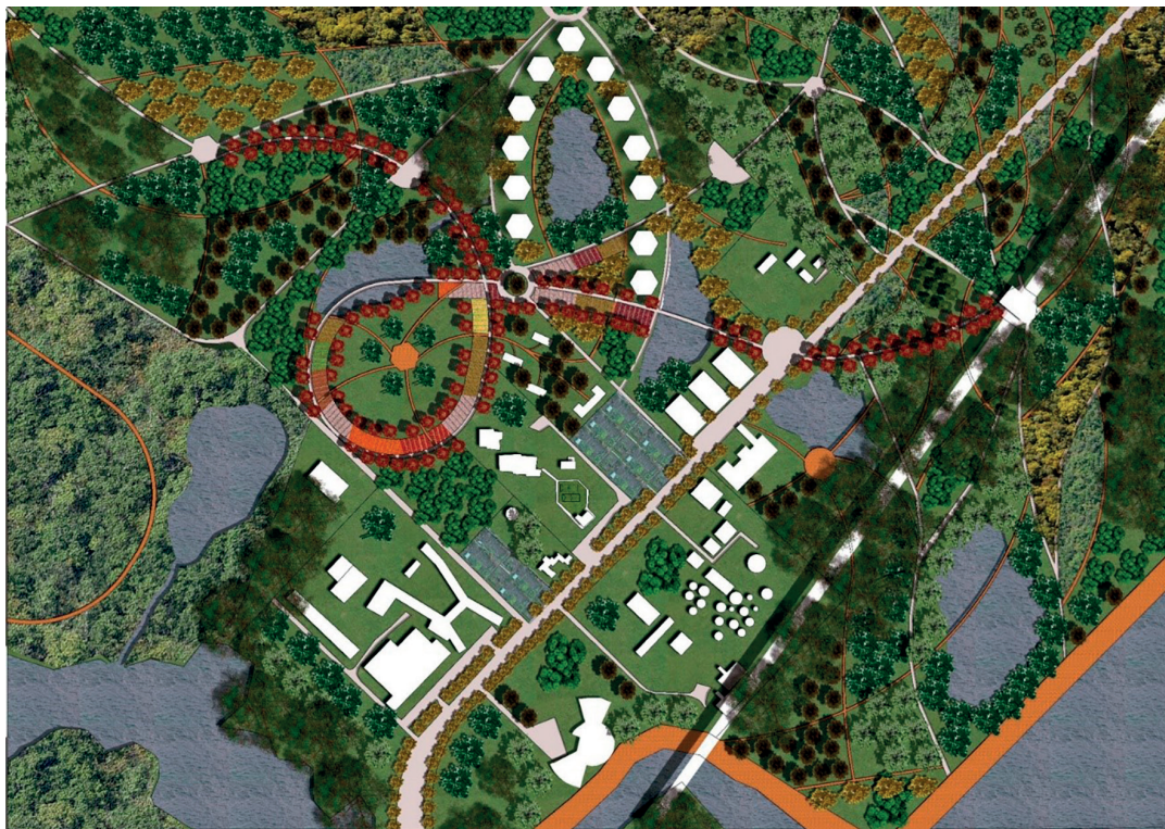
Figura 2. Plan Maestro.

Nota: En el plan parcial se tiene en cuenta las diferentes especies de vegetación nativa de Bogotá, Recuperando los bosques, los humedales, y permitiendo modificar los métodos de cultivo.