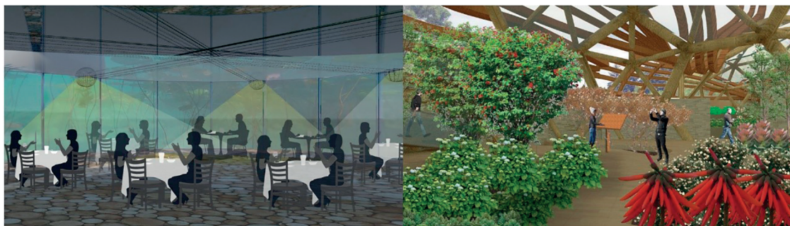
Figura 3. Atracción turística dentro de la reserva.

Nota: los espacios interiores están pensado para generar confort a los usuarios que visitan este proyecto, permitiendo que se puedan experimentar diferente ambiente en un mismo lugar.